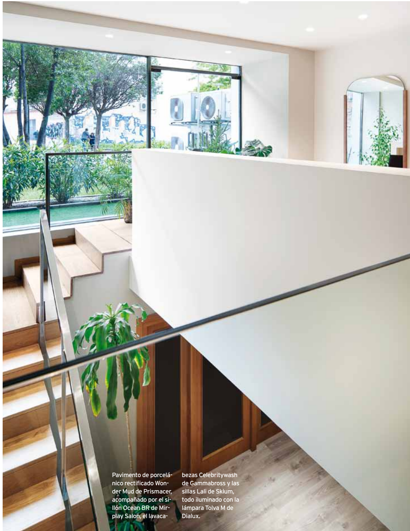
Pavimento de porcelánico rectificado Wonder Mud de Prismacer, acompañado por el sillón Ocean BR de Mir-play Salon, el lavaca- bezas Celebritywash de Gammabross y las sillas Lali de Sklum, todo iluminado con la lámpara Tolva M de Dialux.